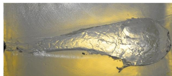
Simulierte Wundhöhle in ballistischer Seife - .300 Win. Mag. SPEED TIP PRO auf 350 m